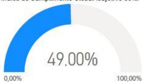
Índice de Cumplimiento Global (objetivo 80%)

El nivel de madurez alcanzado globalmente por la entidad corresponde al nivel L1